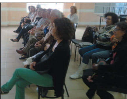
Encuentro de CEOM (Murcia)