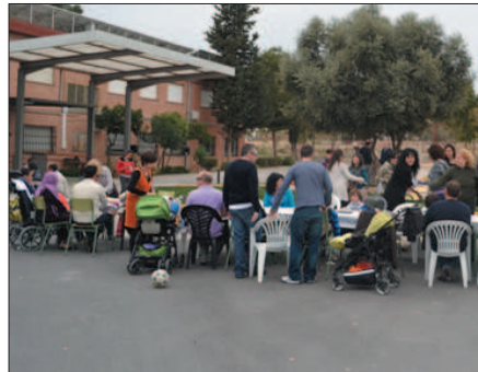
AMPA del Eusebio Martínez (Alcantarilla)