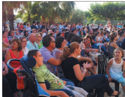
Encuentro de ASTRAPACE (Murcia)