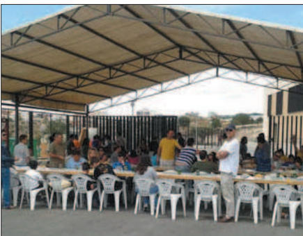
Encuentro de ASTRADE (Molina de Segura)