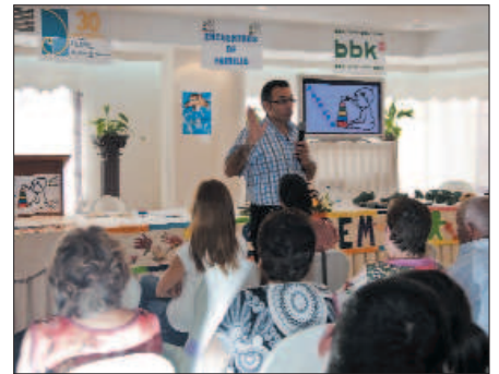
Encuentro de APANDIS (Mazarrón)