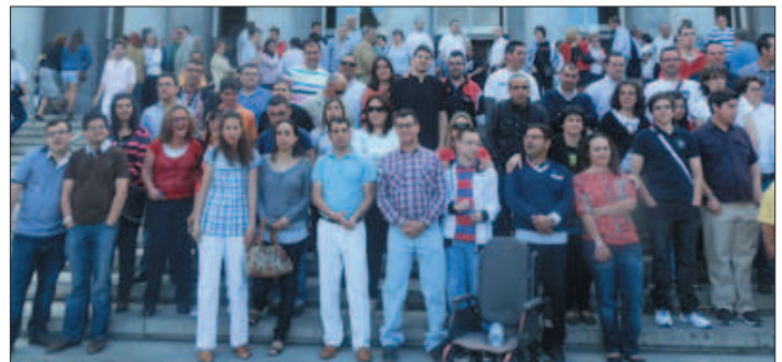
El grupo de opositores de asociaciones de FEAPS RM, en Madrid

El Estado ha convocado dos plazas de empleo público para personas con discapacidad intelectual en la Región de Murcia. Para conseguir el trabajo, hay que superar una oposición. La primera parte es un examen. El examen se hizo el 19 de marzo en Madrid. 60 murcianos con discapacidad han aprobado.