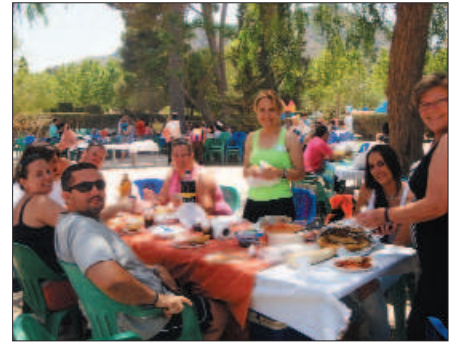
Encuentro de ASIDO Cartagena

Las asociaciones han hecho encuentros para reunir a todas sus familias. También han hecho grupos para hablar y ayudarse. Se llaman grupos de apoyo emocional.