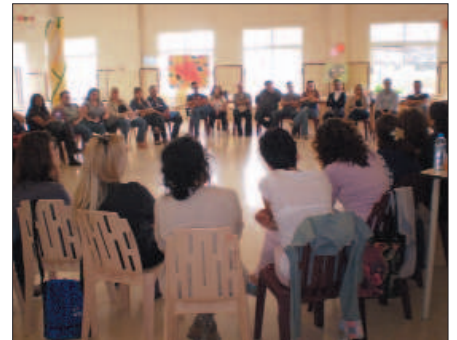
Reunión de grupos de ASTUS (Cartagena)