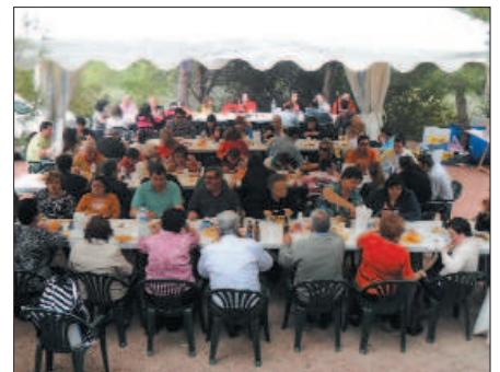
Encuentro de PADISITO (Totana)