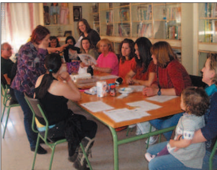
Grupo de apoyo de ASCRUZ (Caravaca)