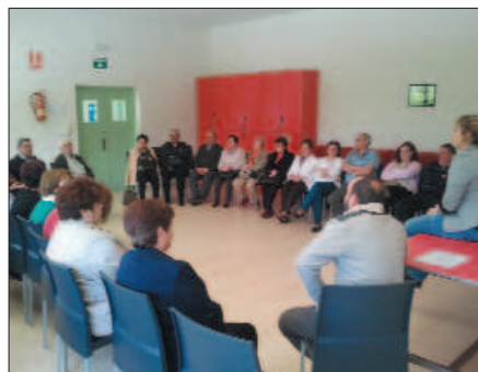
Grupo de familiares de INTEDIS (Mula)