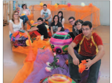
Grupo de hermanos de ASSIDO (Murcia)